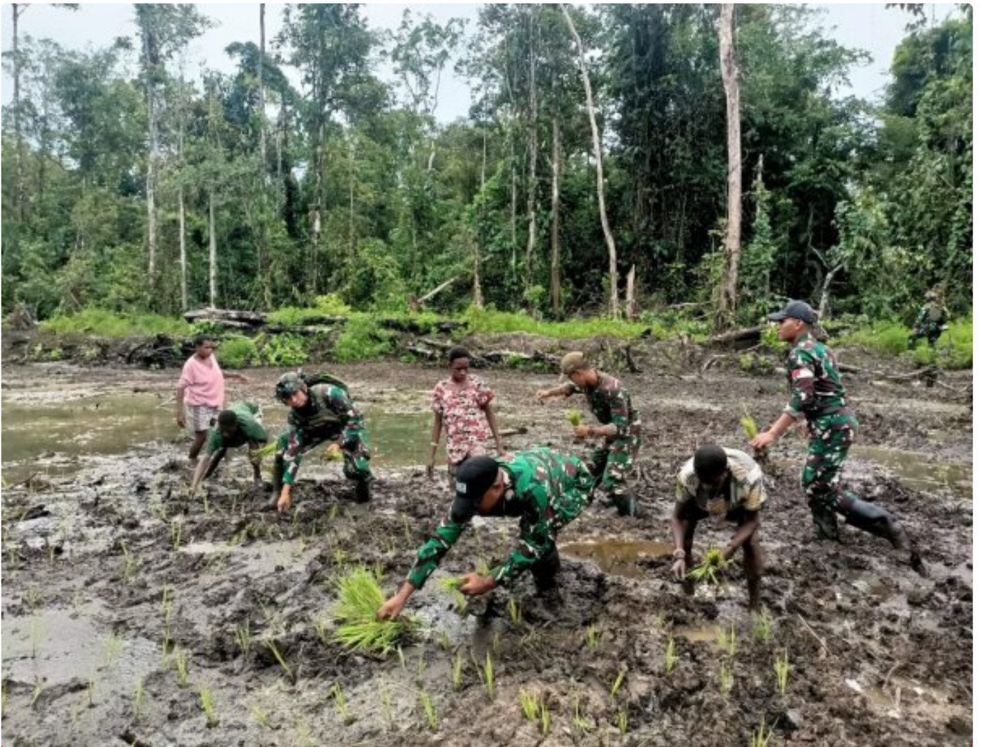
Foto: Satgas Pamtas Mobile RI-PNG Yonif 503/Mayangkara menggagas program ketahanan pangan yang melibatkan langsung warga Kampung Mumugu, Distrik Krepkuri, Kabupaten Nduga, Selasa (07/01/2025).

NDUGA- Dalam upaya membangun kesejahteraan masyarakat di wilayah